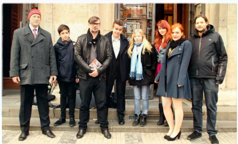
Literature Live - vybraní studenti gymnázia